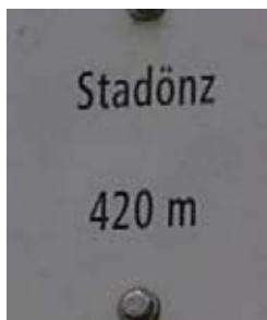
Das Wasser rauscht